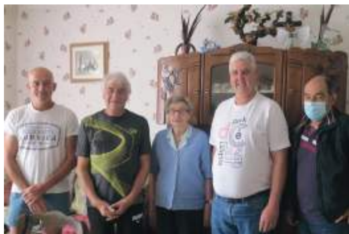
Quatre jeunes messieurs pour honorer une centenaire.