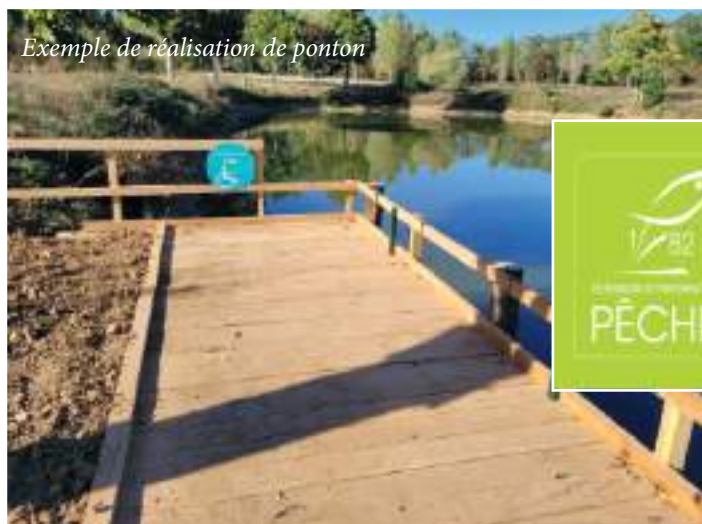
Exemple de réalisation de ponton

La fédération de pêche du Tarn et Garonne est chargée de la gestion du lac de BREGNOL. Pour cela, elle rappelle que le permis de pêche est obligatoire sur le lac depuis novembre 2021. À la suite du lâcher de poissons blancs (gardon), le lac est très fréquenté pour ce loisir de pêche. Nous pouvons voir les aménagements faits par les pratiquants tout autour du lac. Pour cette année 2023 elle va faire un lâcher de Blackbass adultes pour améliorer la reproduction. Et pour l'année 2024, elle prévoit un aménagement du plan d'eau avec la mise en place d'un ponton, d'un parking et d'une rampe de mise à l'eau pour les barques. Petit rappel les moteurs thermiques ne sont pas autorisés à naviguer sur le lac.